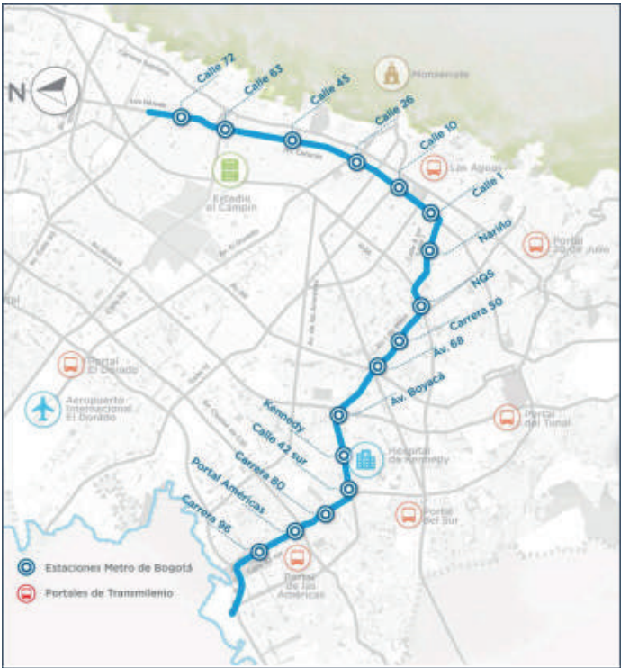
Mapa 2. Metro de Bogotá. Trazado de la ruta que se construirá. 2020.